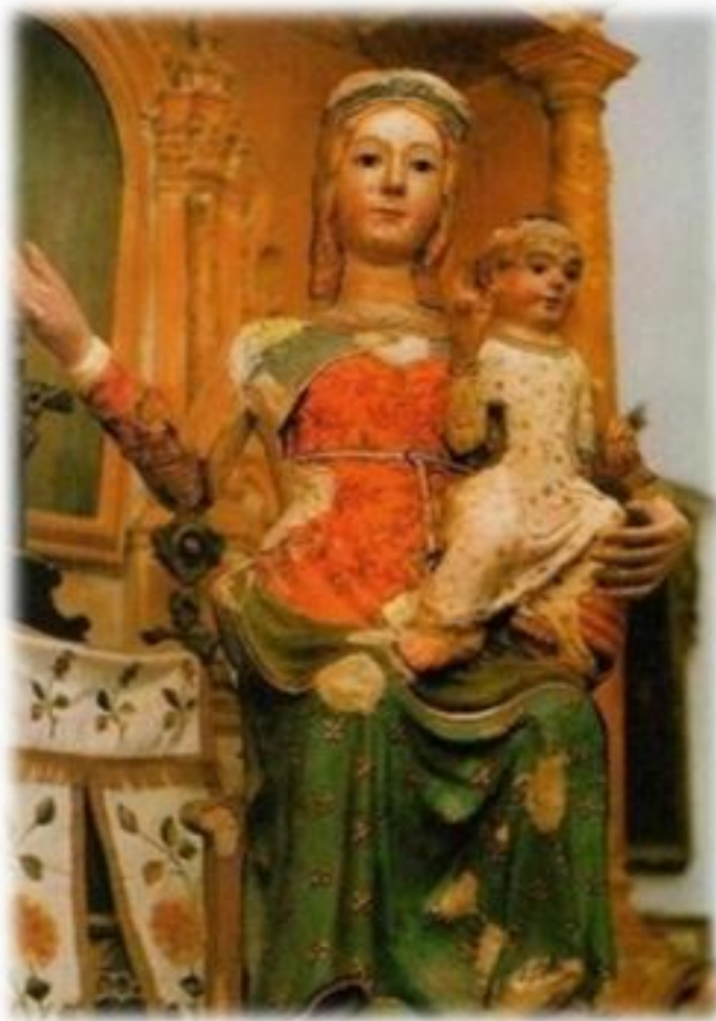
La statua lignea dell'Assunta 1980