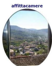
IL BORGO ANTICO (cusano mutri)